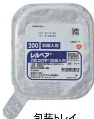
包装トレイ (レルベア)