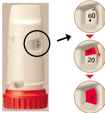
シムビコート、オーキシス